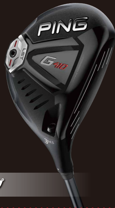
飛びが進化した3つのヘッドタイプ